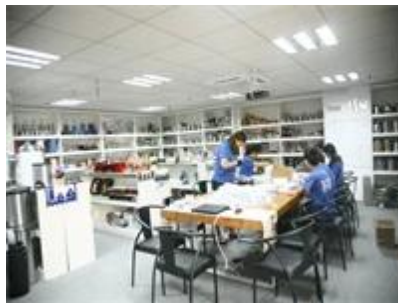
Образец комнаты 1