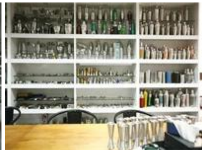
Образец комнаты 2