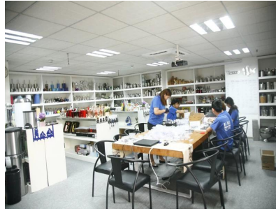
Salle de l'échantillon 1