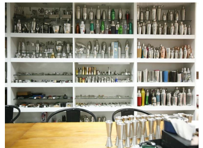
Sample Room 2