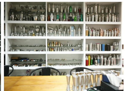
Salle de l'échantillon 2