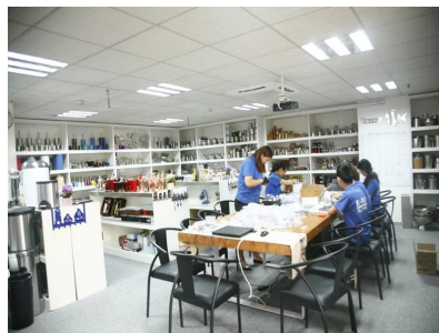
Salle de l'échantillon 1