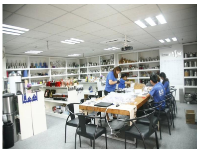
Salle d'exposition 1