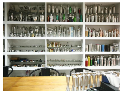
Salle d'exposition 2