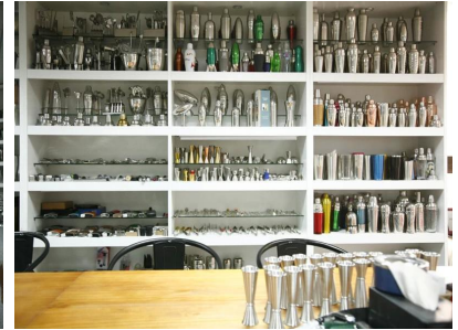
Muestra de la habitación 2