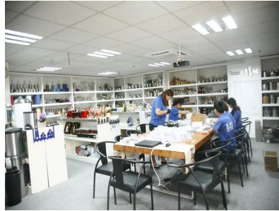
Muestra de la habitación 1