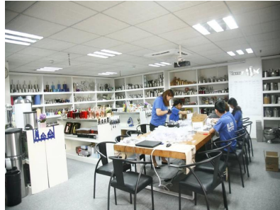
Muestra de la habitación 1