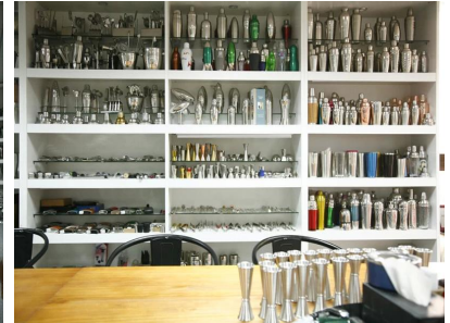
Muestra de la habitación 2