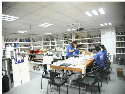
Exemple de pièce 1